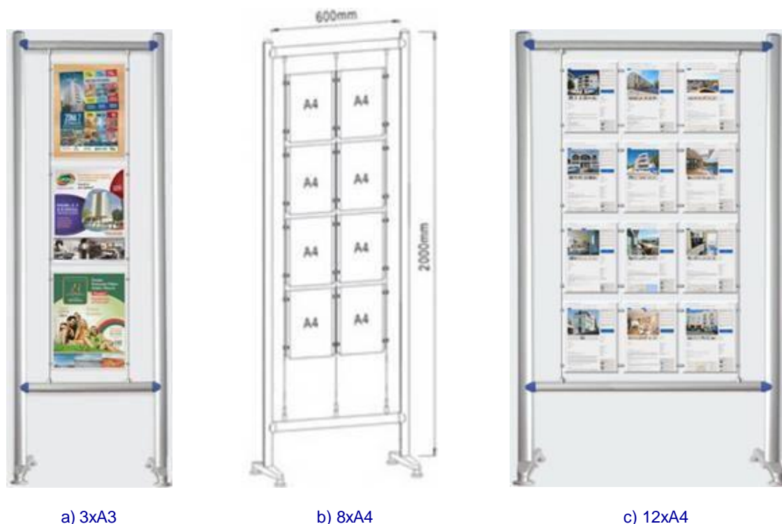
a) 3x A3

*Com bolsas acrílicas em U fixas por 2 cabos verticais esticados na estrutura de tubo quadrado 25x25mm.