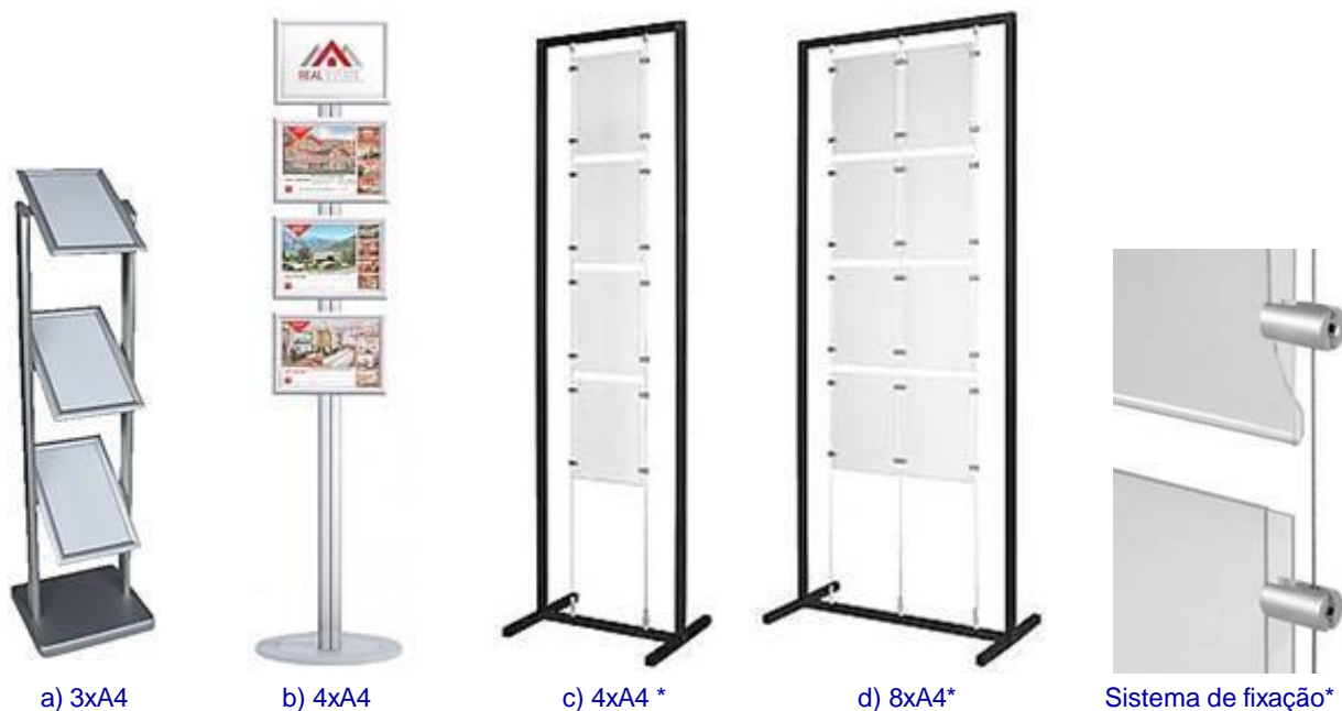
a) 3x A4