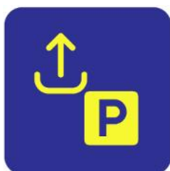
Estacionamento Acessos e Entrada