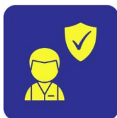
Vestiários, Higiene e Segurança