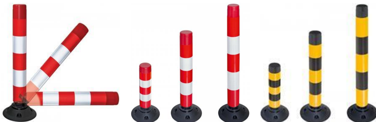
3 tamanhos em branco e vermelho