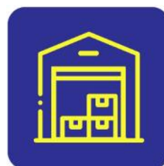
Economato e Armazém