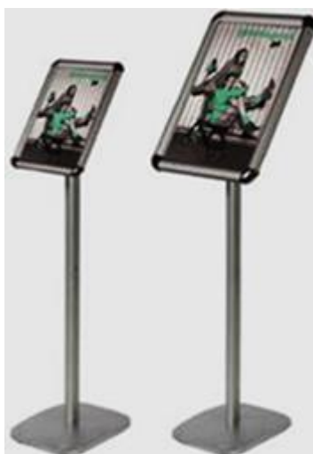
a) + b)