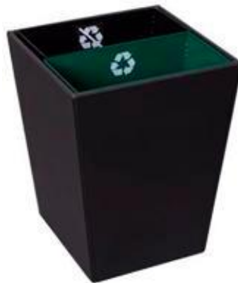
Com 2 cubas metálicas interiores removíveis