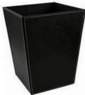
Sem cuba interior