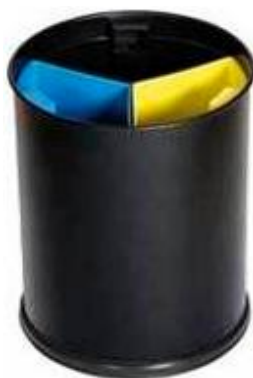
Preto com 3 compartimentos preto, azul e amarelo