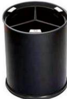
Preto com 3 compartimentos pretos