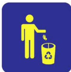
Alojamentos e Serviços Diversos