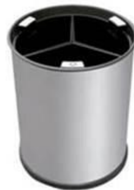
Satinado com 3 compartimentos pretos