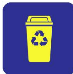
Zonas Públicas Interior e Exterior