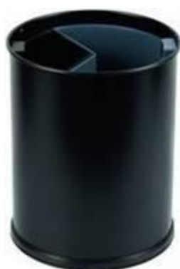
Preto com 2 compartimentos

Ecoponto Design em metal pintado a epóxi preto com 2 compartimentos 23x27cm alt - 10L ----- 40€/conj Com 2 recipientes internos, em cinza claro e cinza escuro, identificados para separação do lixo.