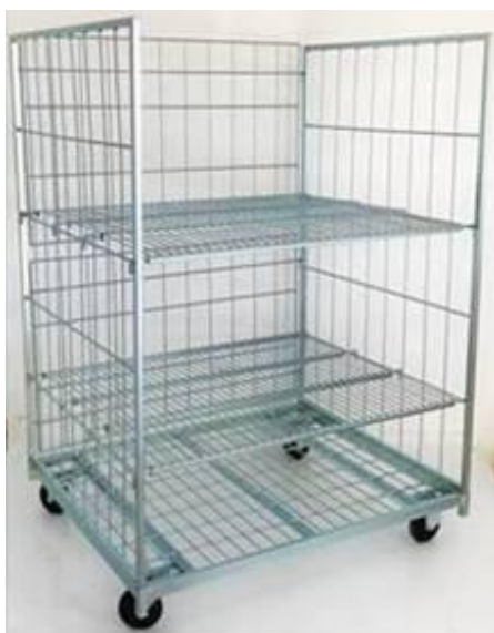
b) + c)